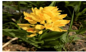
67. ジュウニヒトエ (十二単)