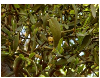
㉒シナヒイラギ、ヒイラギ (柊)