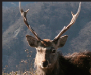
シカはなぜ増え続けるのか？