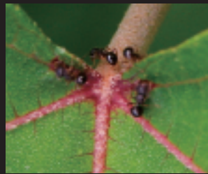
なぜ葉にアリが集まる？