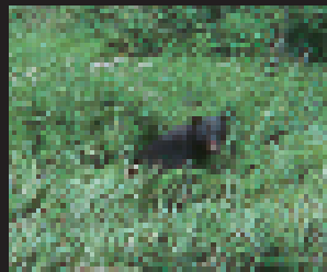
クマを絶滅させるとどうなる？

●日時： 2020年2月15日(土) 13:30~16:00 (受付開始13:00)