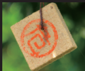
沖縄で見かける「危」の正体